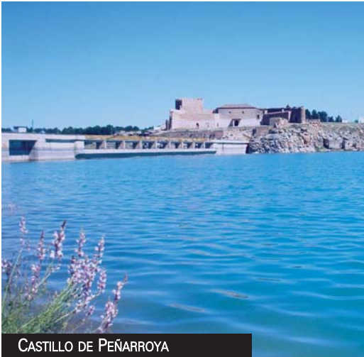
CASTILLO DE PEÑARROYA

Naturaleza, Historia y Literatura se mezclan intensamente en estas tierras