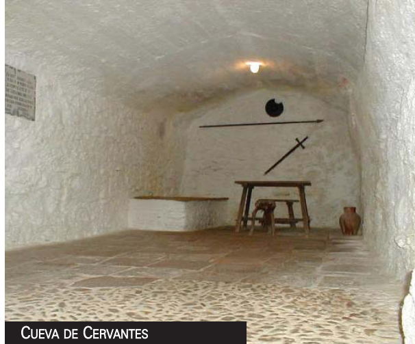
CUEVA DE CERVANTES

Según las relaciones topográficas de Felipe II, Argamasilla de Alba se fundó en el sitio donde está ahora sobre el año 1531-1532 por el alcaide del castillo de Peñarroya.