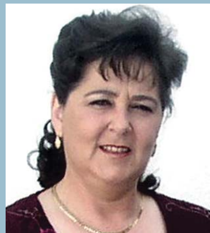
JOSEFA PORRAS MORALES CONCEJALA DE IGUALDAD DE GÉNERO, PARTICIPACIÓN CIUDADANA, SALUD Y CONSUMO