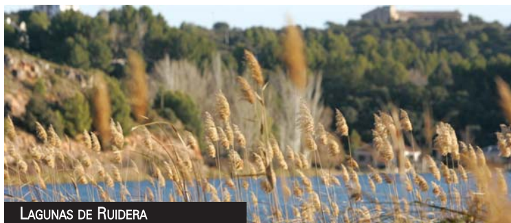
LAGUNAS DE RUIDERA

Este edificio se empieza a construir con el siglo XVI, al mismo tiempo que la iglesia de San Juan, pero al igual que una parte de la