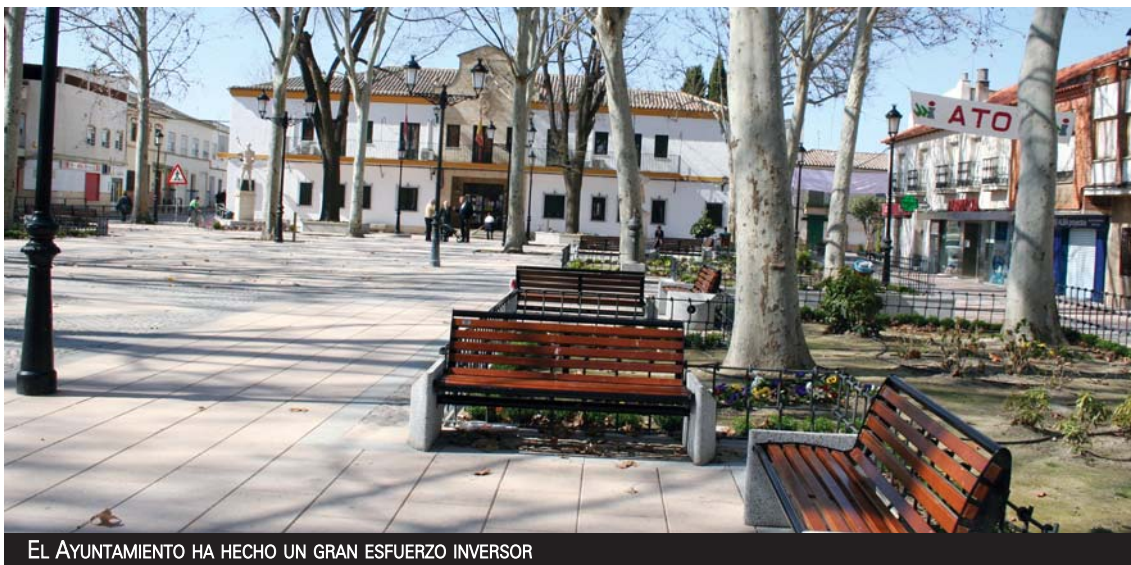
EL AYUNTAMIENTO HA HECHO UN GRAN ESFUERZO INVERSOR

La adquisición de terreno para la ampliación del Polígono Municipal de La Serna Fase IV, el equipamiento del Teatro Auditorio o la instalación del césped artificial en el campo de fútbol, son los proyectos que supondrán la mayor inversión municipal prevista