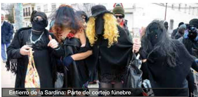
Entierro de la Sardina: Parte del cortejo fúnebre