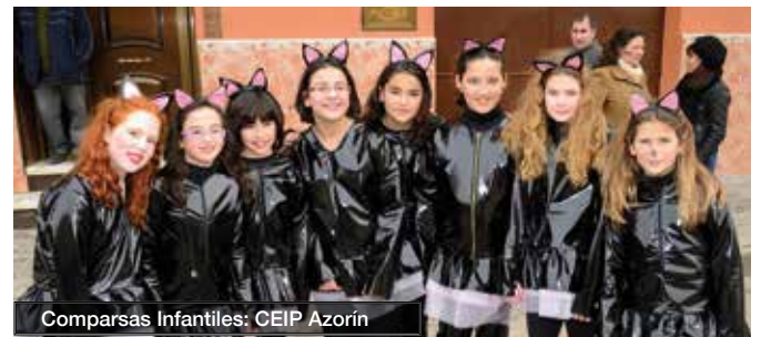
Comparsas Infantiles: CEIP Azorín