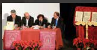
► Argamasilla de Alba ya tiene su Quijote de Avellaneda manuscrito "entre todos"