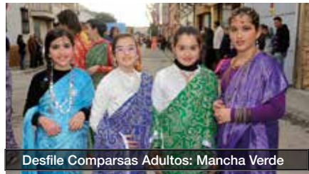
Desfile Comparsas Adultos: Mancha Verde