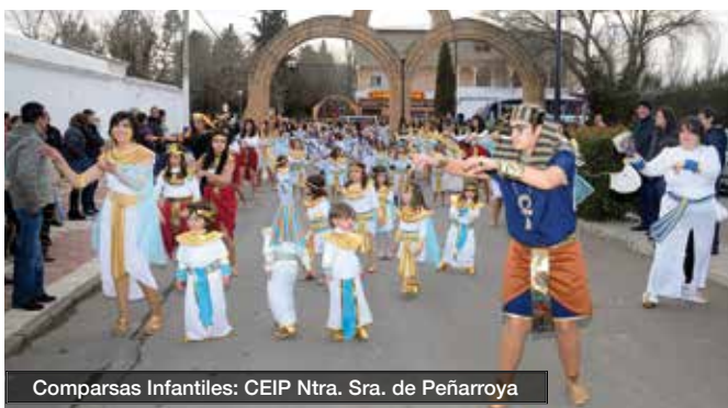
Comparsas Infantiles: CEIP Ntra. Sra. de Peñarroya