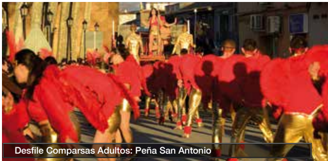
Desfile Comparsas Adultos: Peña San Antonio