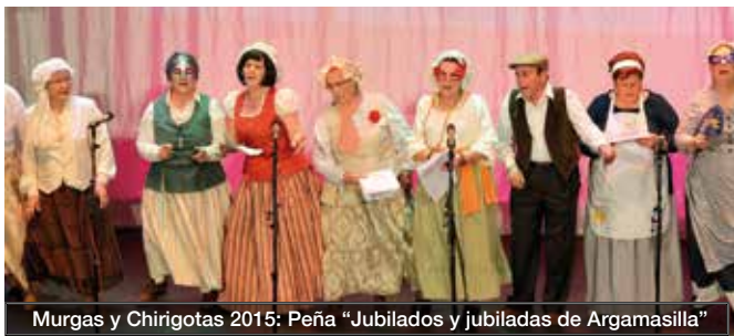
Murgas y Chirigotas 2015: Peña "Jubilados y jubiladas de Argamasilla"