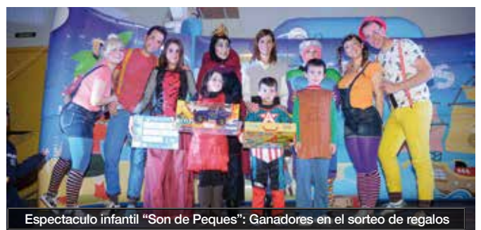
Espectaculo infantil "Son de Peques": Ganadores en el sorteo de regalos