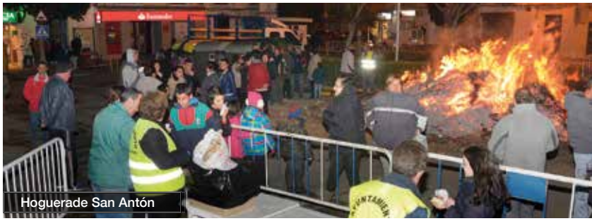
Hoguerade San Antón