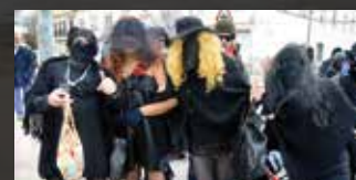
► La localidad celebró uno de los carnavales más participativos de los últimos años