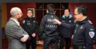
► La Policía Local cambia de uniformidad para adaptarse a la normativa regional