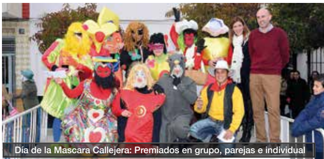
Día de la Mascara Callejera: Premiados en grupo, parejas e individual