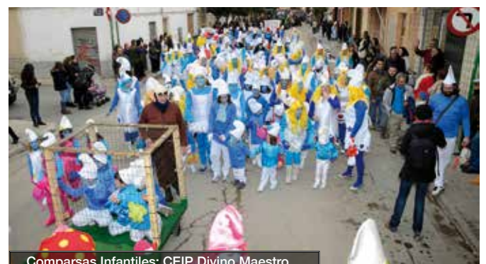
Comparsas Infantiles: CEIP Divino Maestro