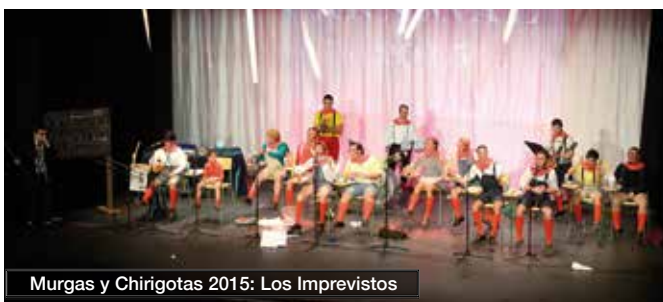
Murgas y Chirigotas 2015: Los Imprevistos