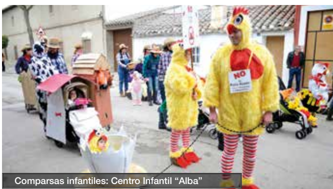
Comparsas infantiles: Centro Infantil "Alba"