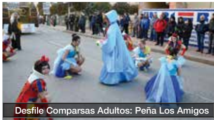
Desfile Comparsas Adultos: Peña Los Amigos