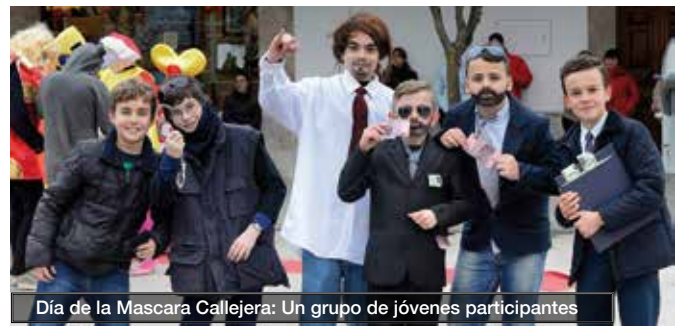
Día de la Mascara Callejera: Un grupo de jóvenes participantes