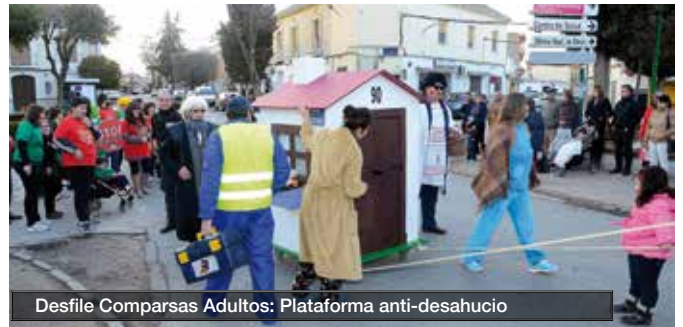
Desfile Comparsas Adultos: Plataforma anti-desahucio