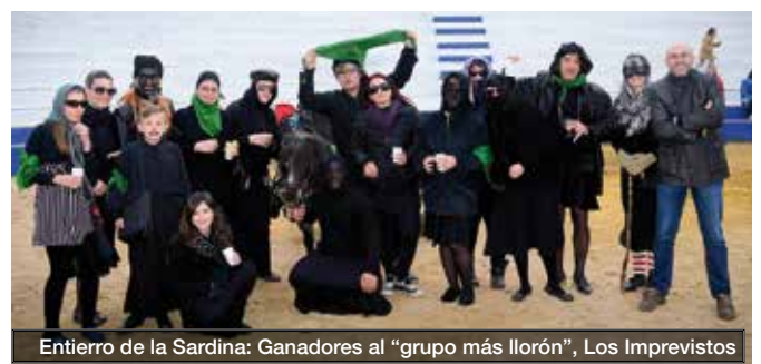
Entierro de la Sardina: Ganadores al "grupo más llorón", Los Imprevistos