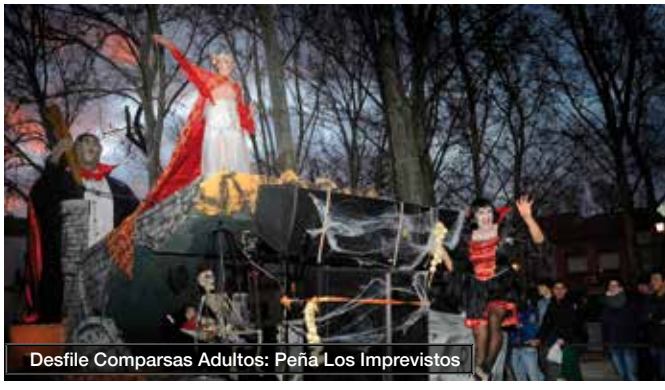
Desfile Comparsas Adultos: Peña Los Imprevistos