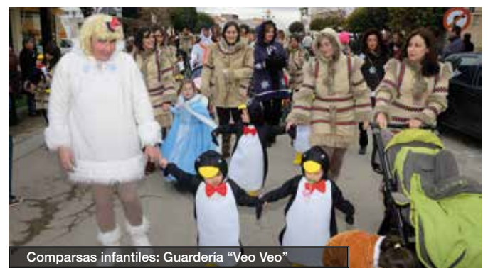
Comparsas infantiles: Guardería "Veo Veo"