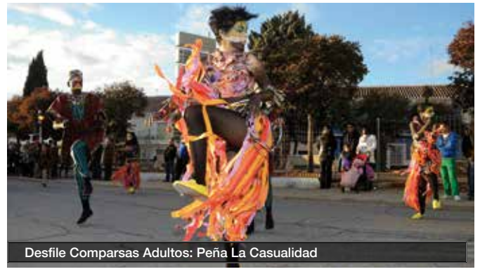
Desfile Comparsas Adultos: Peña La Casualidad