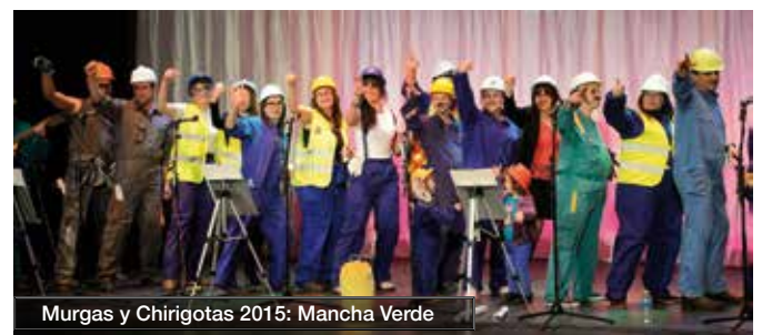
Murgas y Chirigotas 2015: Mancha Verde