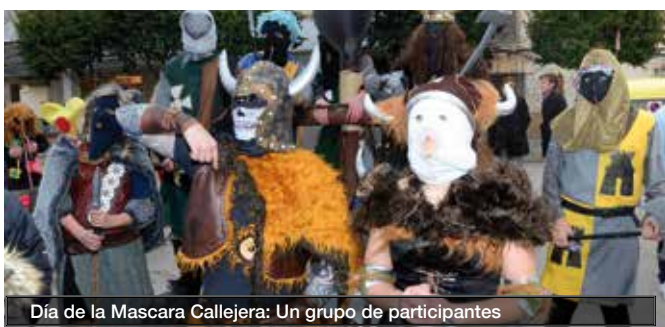
Día de la Mascara Callejera: Un grupo de participantes