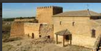
► El miércoles 19 de noviembre se precipitó parte de uno de los muros del Castillo de Peñarroya