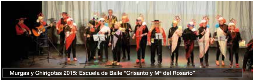
Murgas y Chirigotas 2015: Escuela de Baile "Crisanto y M a del Rosario"