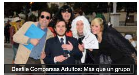
Desfile Comparsas Adultos: Más que un grupo