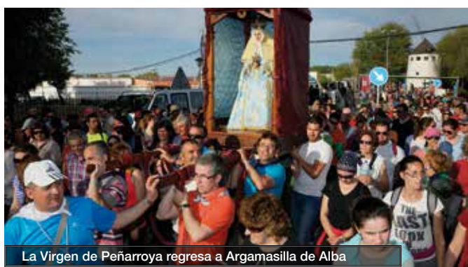
La Virgen de Peñaroya regresa a Argamasilla de Alba