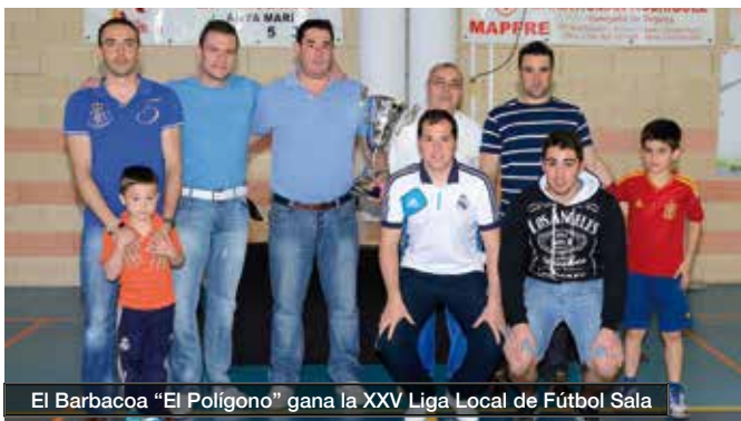
El Barbacoa "El Polígono" gana la XXV Liga Local de Fútbol Sala