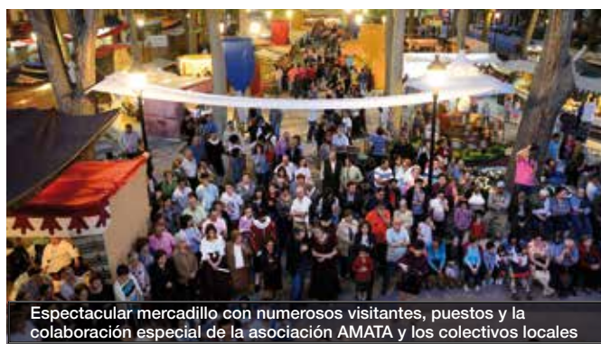
Espectacular mercadillo con numerosos visitantes, puestos y la colaboración especial de la asociación AMATA y los colectivos locales