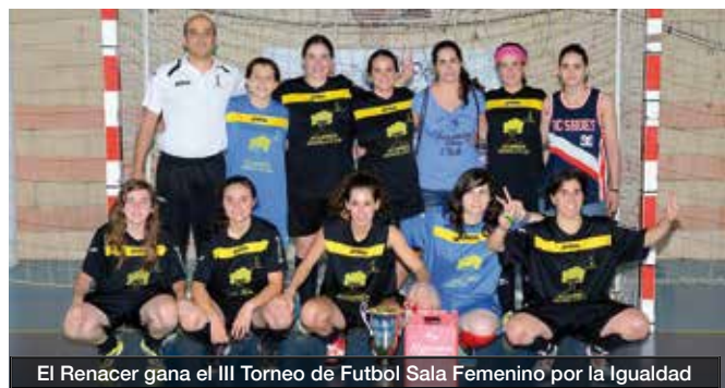
El Renacer gana el III Torneo de Fútbol Sala Femenino por la Igualdad