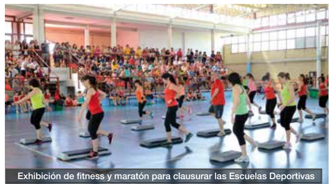
Exhibición de fitness y maratón para clausurar las Escuelas Deportivas