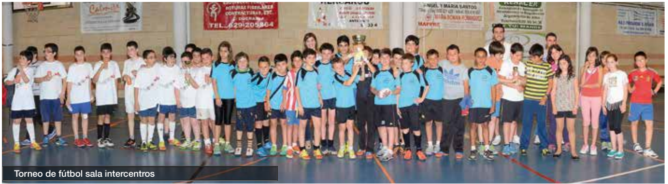
Torneo de fútbol sala intercentros