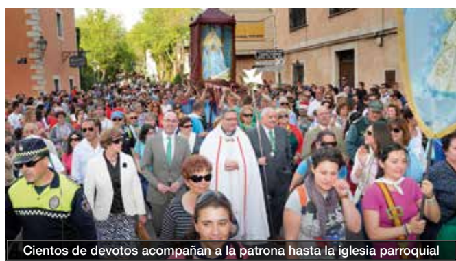
Cientos de devotos acompañan a la patrona hasta la iglesia parroquial