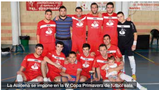
La Alacena se impone en la IV Copa Primavera de fútbol sala