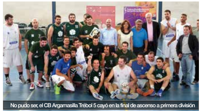
No pudo ser, el CB Argamasilla Trébol 5 cayó en la final de ascenso a primera división