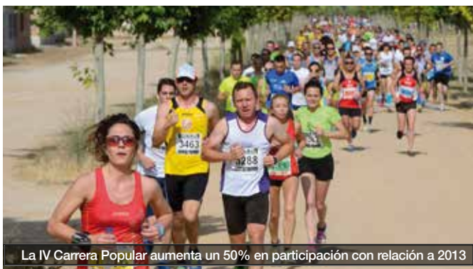
La IV Carrera Popular aumenta un 50% en participación con relación a 2013