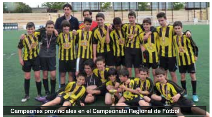
Campeones provinciales en el Campeonato Regional de Fútbol