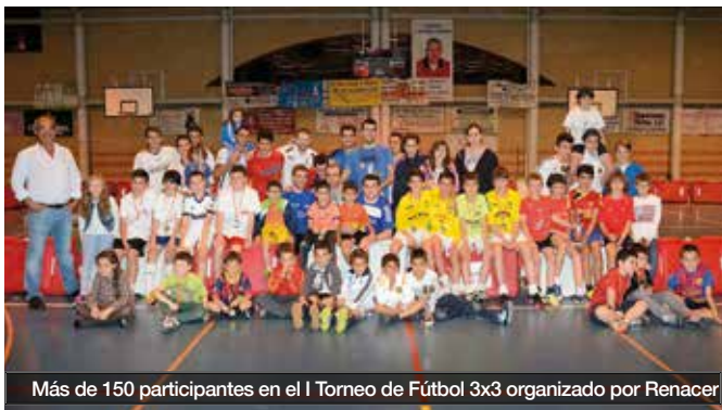
Más de 150 participantes en el I Torneo de Fútbol 3x3 organizado por Renacer