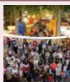
Imagen de portada: X Mercadillo Cervantino durante la inauguración. Paseo central de La Glorieta con los puestos y decoración montados para la ocasión

Los votos favorables del PSOE y PP permitieron sacar adelante la propuesta del Equipo de Gobierno para la modificación presupuesta-