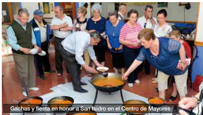
Gachas y fiesta en honor a San Isidro en el Centro de Mayores