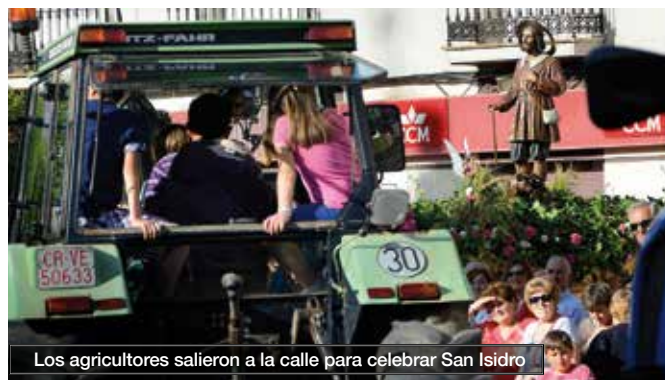
Los agricultores salieron a la calle para celebrar San Isidro