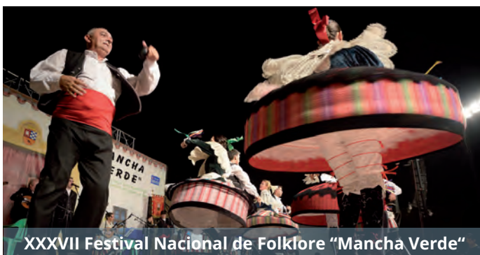
XXXVII Festival Nacional de Folklore "Mancha Verde"