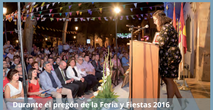
Durante el pregón de la Feria y Fiestas 2016