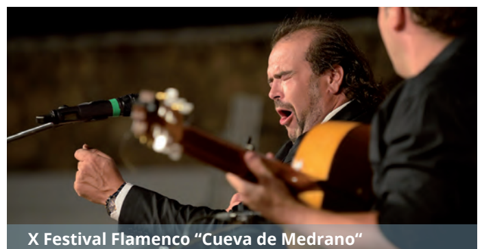
X Festival Flamenco "Cueva de Medrano"