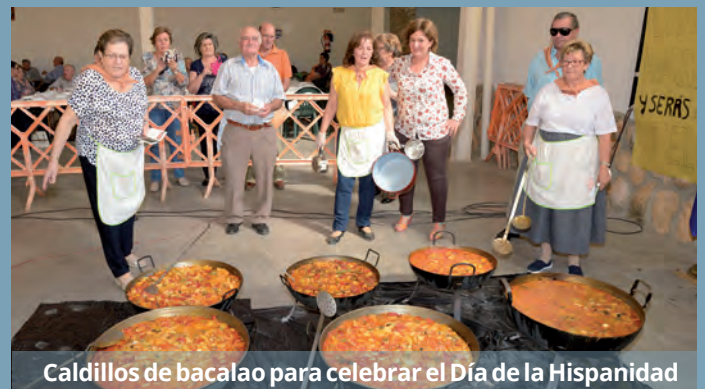
Caldillos de bacalao para celebrar el Día de la Hispanidad