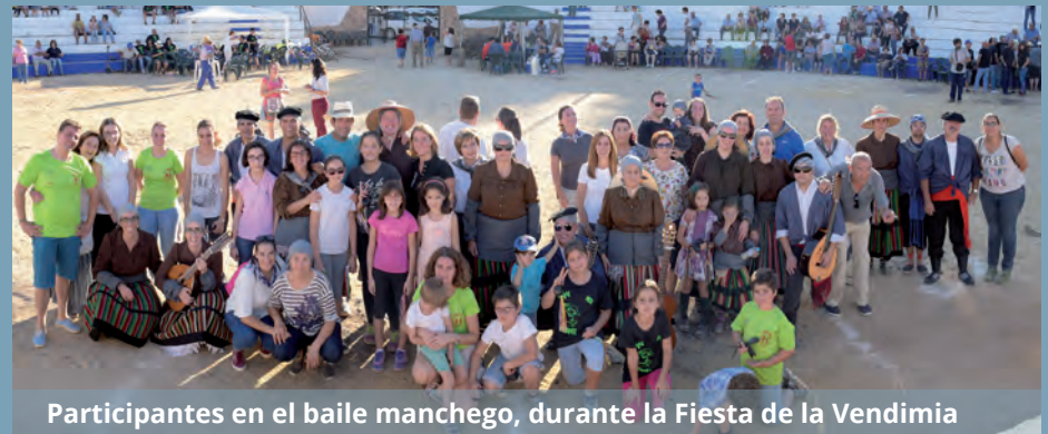
Participantes en el baile manchego, durante la Fiesta de la Vendimia