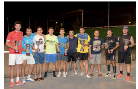
Veinte parejas en el XIII Maratón de Tenis de Dobles

Tras un intenso fin de semana (5 - 6 y 7 de agosto) de fútbol sala, el Bar "El Norte" de Tomelloso, se impuso en la final del XXVII Maratón Nacional por 6 a 4 al Colmenar Viejo de esta misma localidad madrileña. Fin de semana que también acogió el I Maratón Nacional Renacer Argamasilla F.S. 2016, en las categorías sub 10 - 12 y 16.