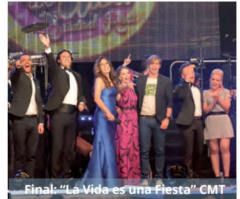
Final: "La Vida es una Fiesta" CMT