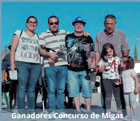
Ganadores Concurso de Migas