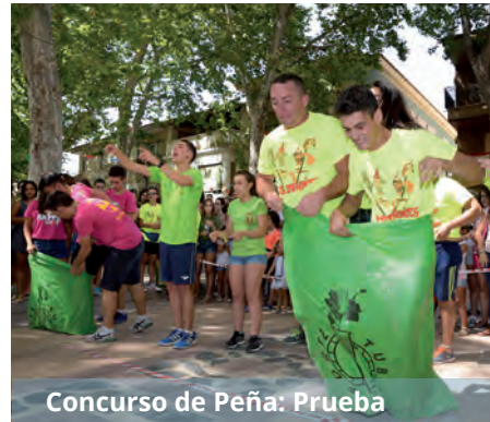
Concurso de Peña: Prueba