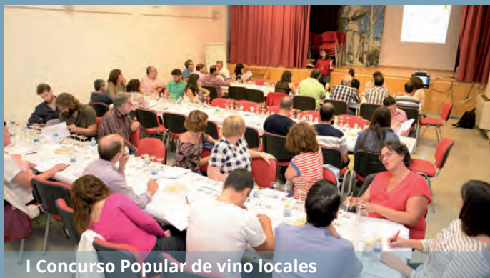
I Concurso Popular de vino locales