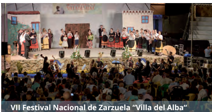
VII Festival Nacional de Zarzuela "Villa del Alba"