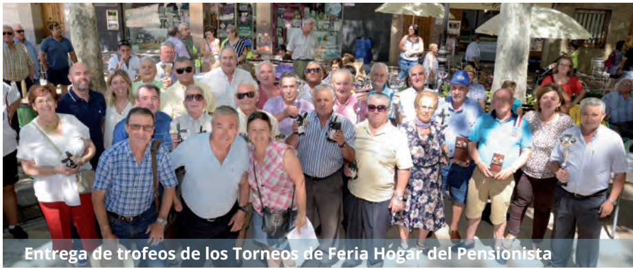
Entrega de trofeos de los Torneos de Feria Hogar del Pensionista