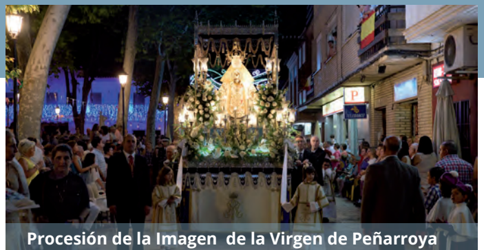
Procesión de la Imagen de la Virgen de Peñarroya