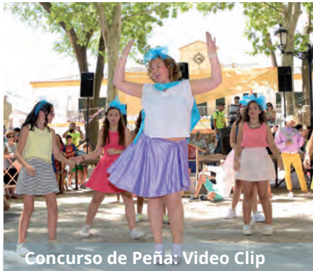
Concurso de Peña: Video Clip