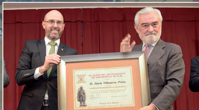
La Biblioteca Municipal pasa a llamarse Cervantes