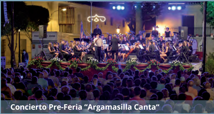
Concierto Pre-Feria "Argamasilla Canta"