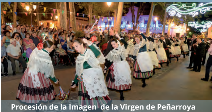
Procesión de la Imagen de la Virgen de Peñarroya