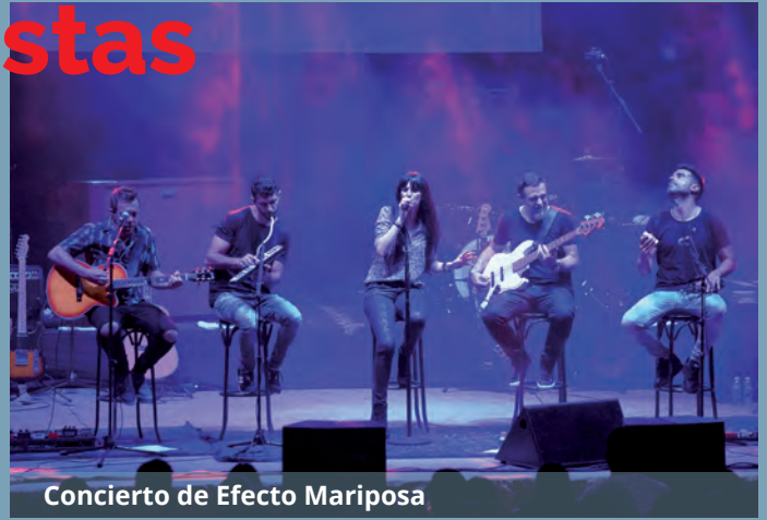
Concierto de Efecto Mariposa