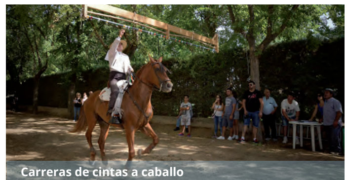
Carreras de cintas a caballo