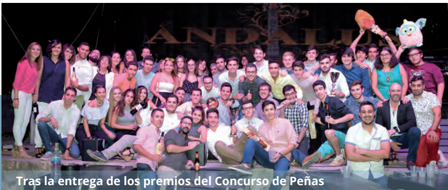
Tras la entrega de los premios del Concurso de Peñas