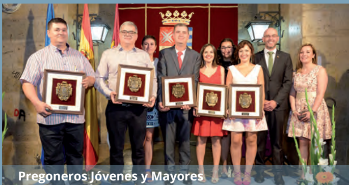
Pregoneros Jóvenes y Mayores