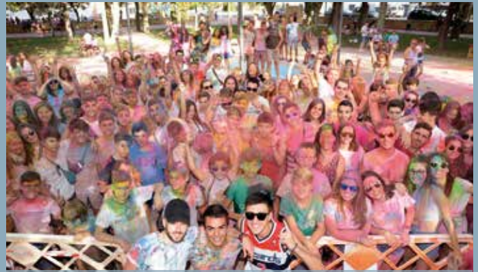
Fiesta Joven de los Colores, con Djs locales