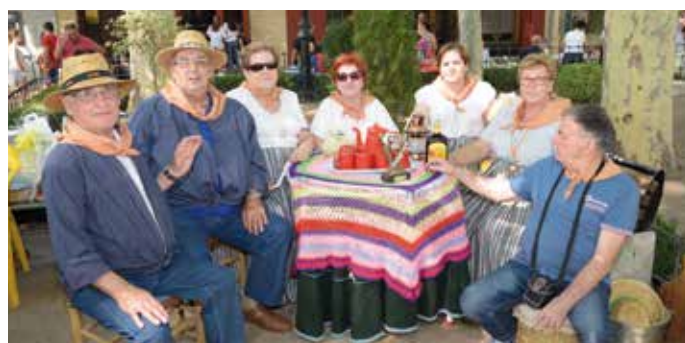
XV Día de la Merendera