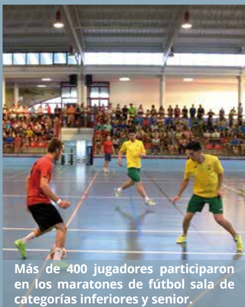
Más de 400 jugadores participaron en los maratones de fútbol sala de categorías inferiores y senior.