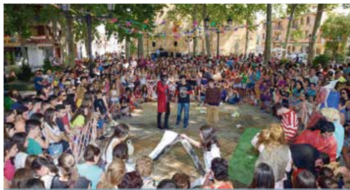
Baile del vermut y concursos de peñas