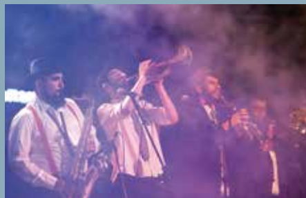
Concierto del grupo local Deskaraos