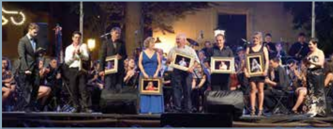
Concierto Especial Pre-Feria "Argamasilla Canta"