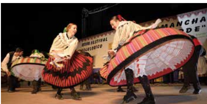
XXXVIII Festival Nacional de Folklore "Mancha Verde"