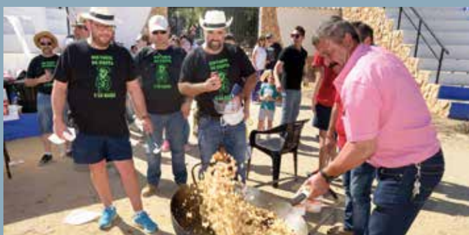
XVIII Fiesta de la Vendimia y concurso de migas