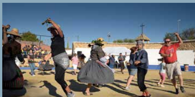
XVIII Fiesta de la Vendimia y baile regional manchego