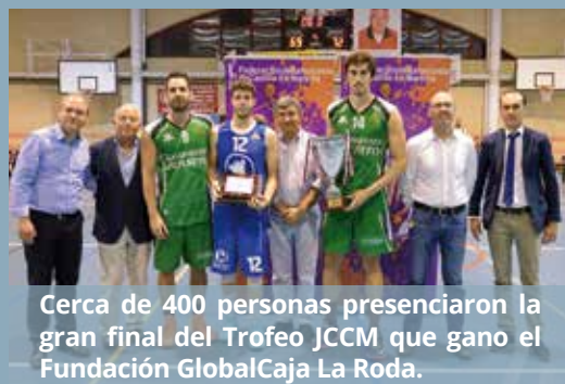
Cerca de 400 personas presenciaron la gran final del Trofeo JCCM que ganó el Fundación GlobalCaja La Roda.