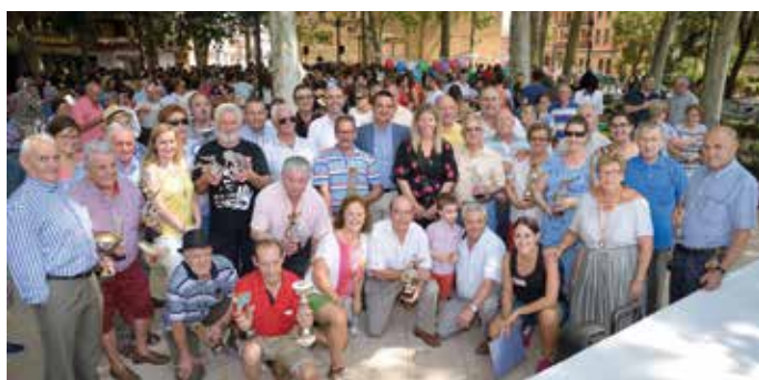
Entrega de trofeos, torneos del Centro de Día de Mayores