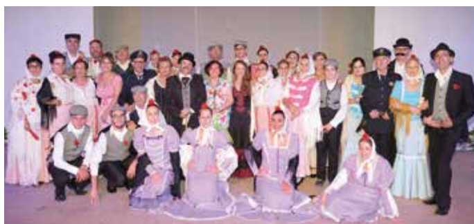
VII Festival Nacional de Zarzuela "Villa del Alba"