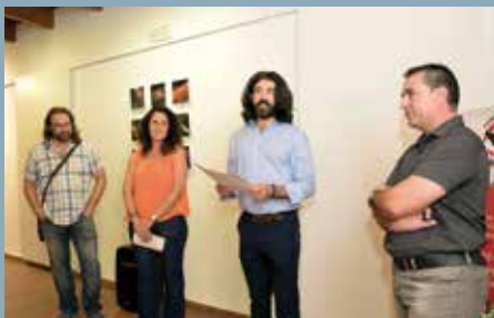
Exposición fotográfica de Cruz Cantón