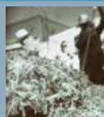
Imagen de portada: Sarten de migas con 140 panes cocinados por los mayores del Centro de Día, durante la XVIII Fiesta de la Vendimia y el Concurso de Migas.

Por su parte, el alcalde, Pedro Ángel Jiménez, calificó la propuesta como "suicidio económico para las arcas municipales". La adopción de estas medidas, según el primer edil, supondría para el Ayuntamiento una reducción de los ingresos en 413.376 euros, lo que llevaría implícito la "total reducción" de inversiones y la eliminación de servicios, y por lo tanto el despido de trabajadores, indicó el alcalde. Además pidió sensatez al grupo popular a la hora de hacer propuestas, al no poder mantenerse el actual nivel de servicios con menos ingresos, y solicitó que dijese "de donde vamos a recortar", de aprobarse la propuesta.