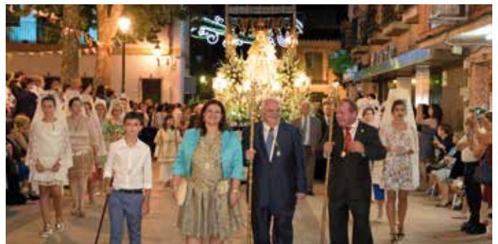
Desfile Procesional de Ntra. Sra. de Peñarroya