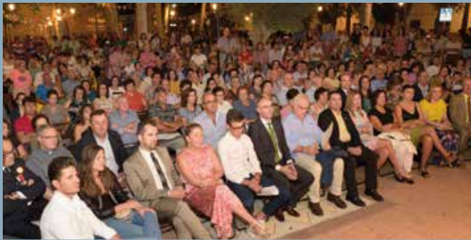
Pregón Feria y Fiestas 2017