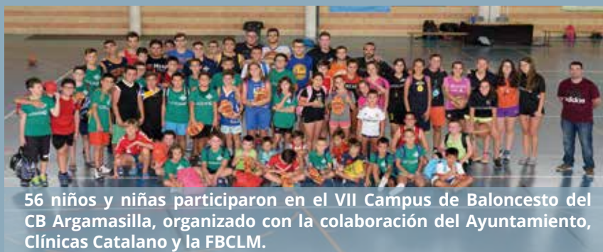
56 niños y niñas participaron en el VII Campus de Baloncesto del CB Argamasilla, organizado con la colaboración del Ayuntamiento, Clínicas Catalano y la FBCLM.