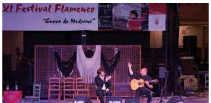
XI Festival Flamenco "Cueva de Medrano"