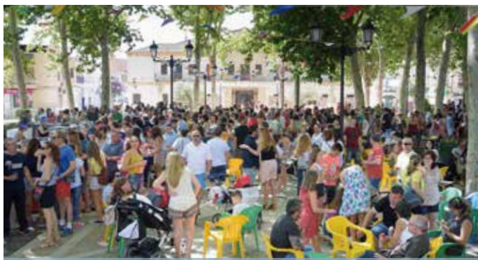
Baile del vermut y concursos gastronómicos