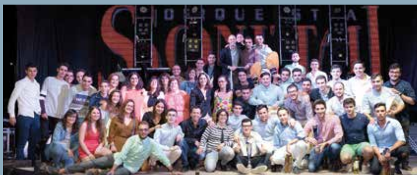
Entrega de premios del Concurso de Peñas