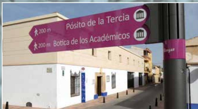
El Ayuntamiento apuesta firmemente por el turismo