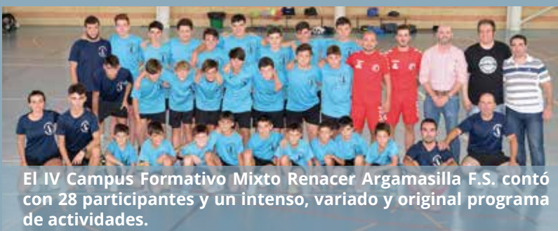
El IV Campus Formativo Mixto Renacer Argamasilla F.S. contó con 28 participantes y un intenso, variado y original programa de actividades.