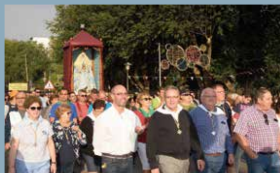
Romería en honor a la Virgen de Peñarroya