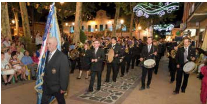
Desfile Procesional de Ntra. Sra. de Peñarroya