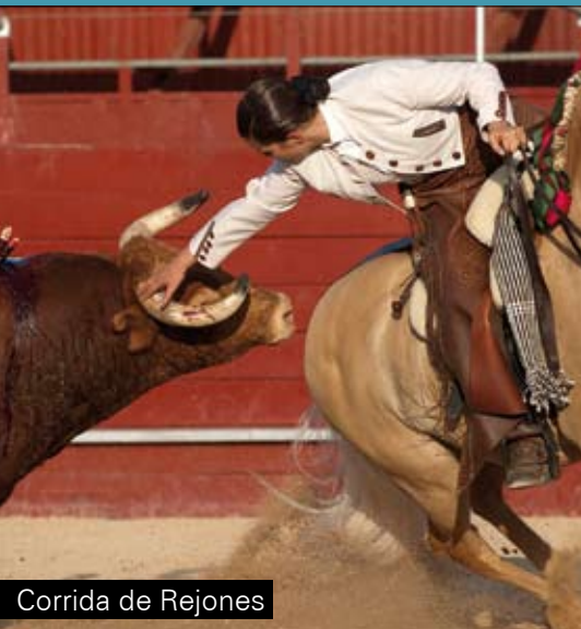
Corrida de Rejones