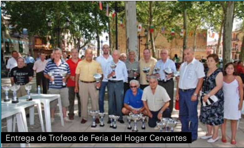
Entrega de Trofeos de Feria del Hogar Cervantes