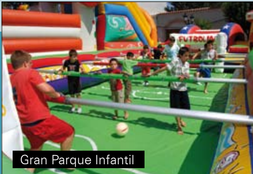
Gran Parque Infantil