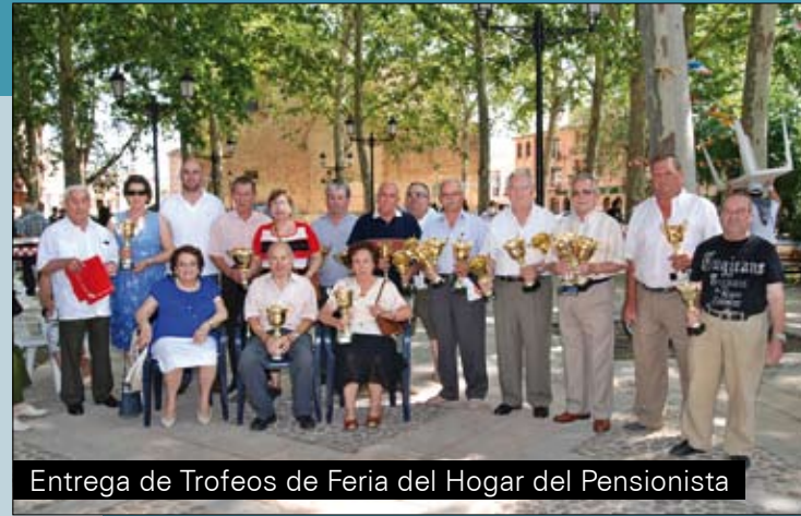
Entrega de Trofeos de Feria del Hogar del Pensionista