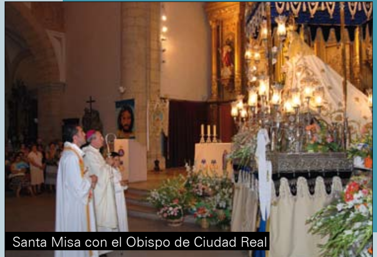
Santa Misa con el Obispo de Ciudad Real