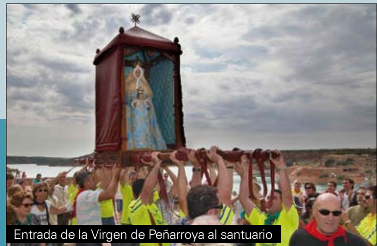
Entrada de la Virgen de Peñarroya al santuario