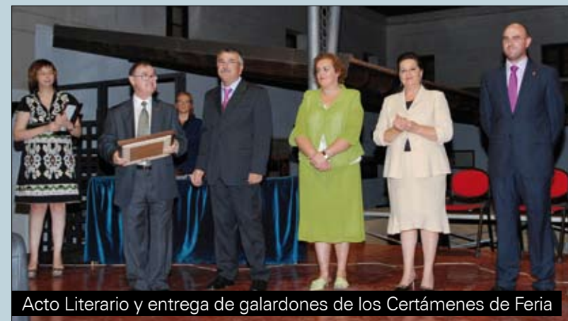
Acto Literario y entrega de galardones de los Certámenes de Feria