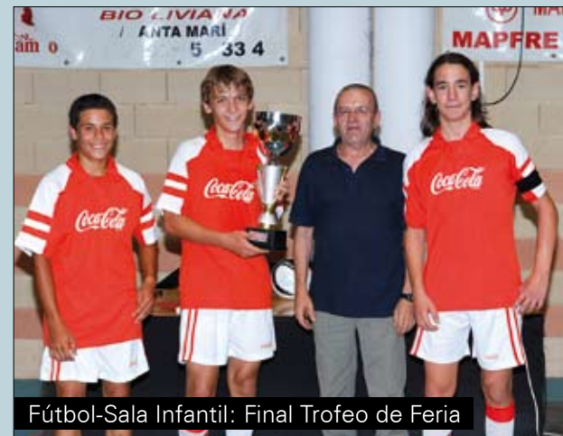
Fútbol-Sala Infantil: Final Trofeo de Feria