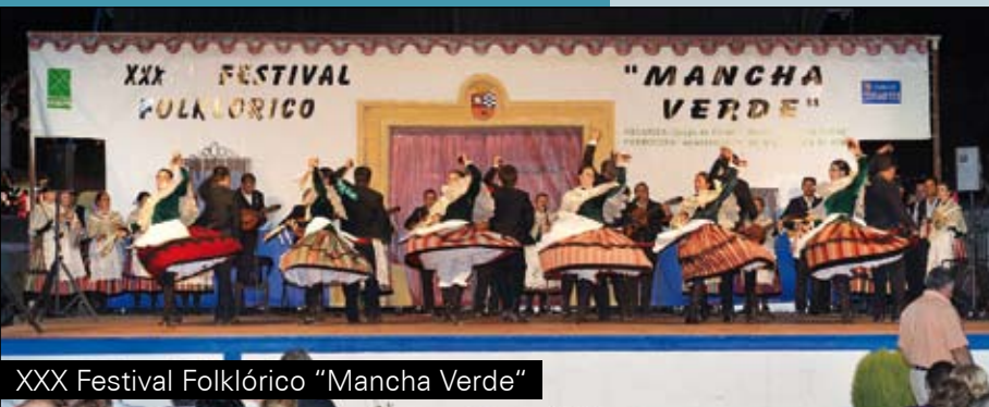
XXX Festival Folklórico "Mancha Verde"