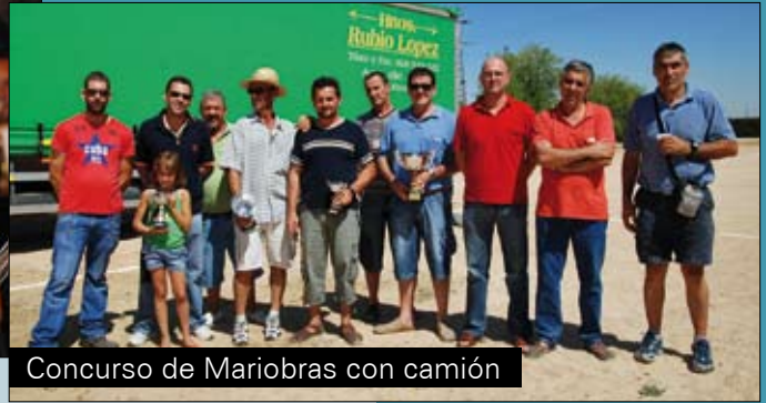
Concurso de Mariobras con camión