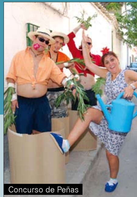
Concurso de Peñas