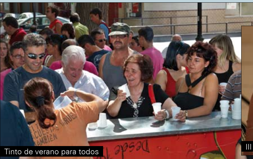
Tinto de verano para todos