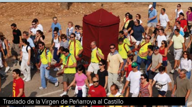
Traslado de la Virgen de Peñarroya al Castillo