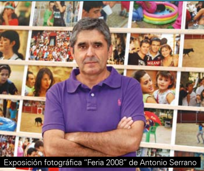
Exposición fotográfica "Feria 2008" de Antonio Serrano