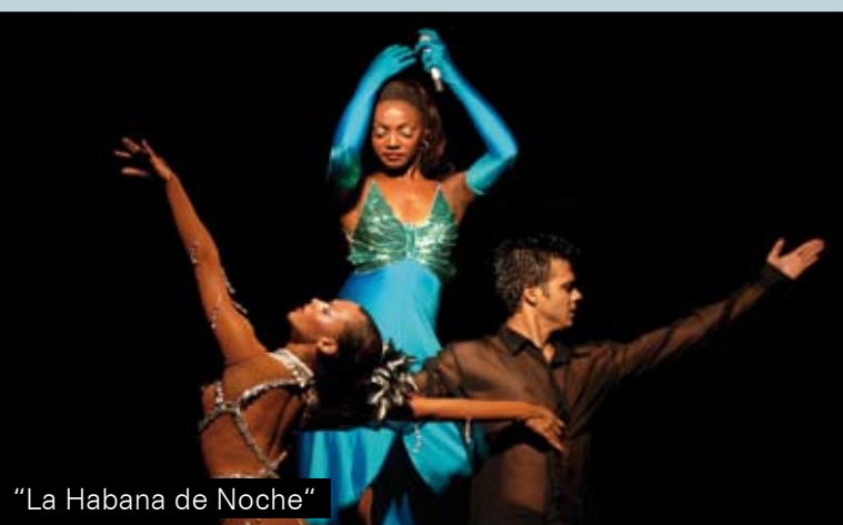
"La Habana de Noche"