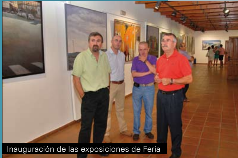
Inauguración de las exposiciones de Feria