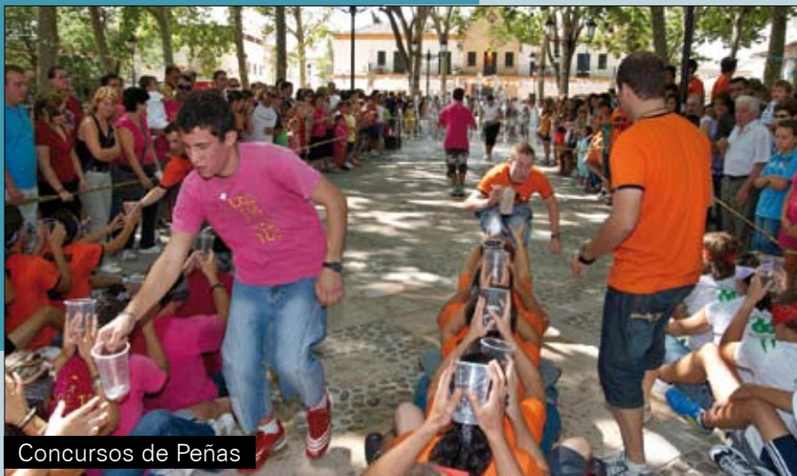
Concursos de Peñas