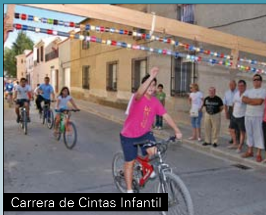
Carrera de Cintas Infantil