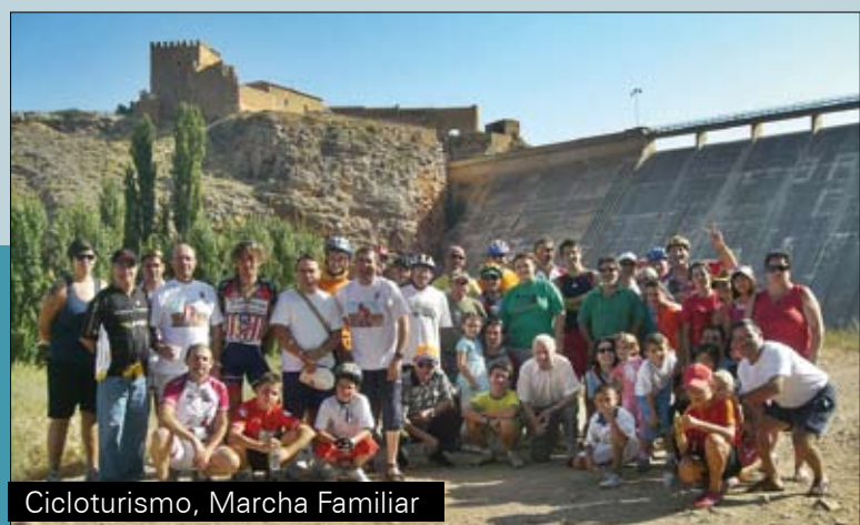
Cicloturismo, Marcha Familiar