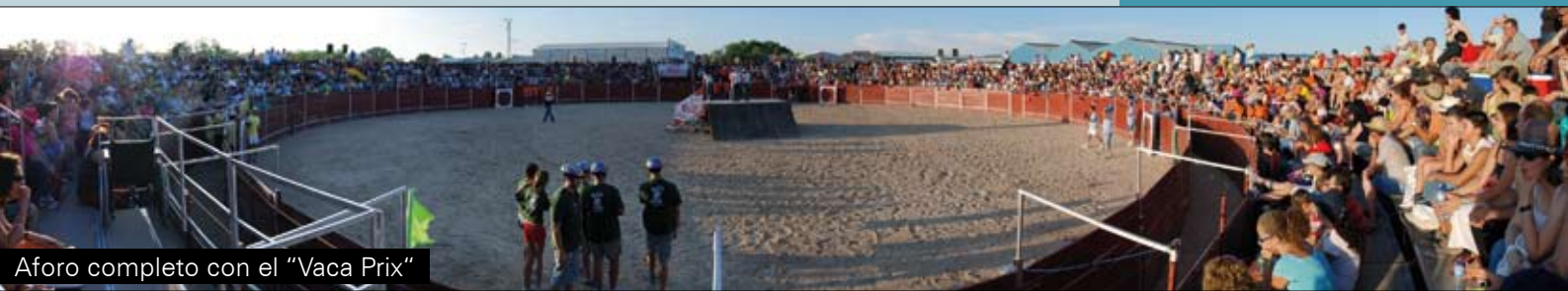
Aforo completo con el "Vaca Prix"