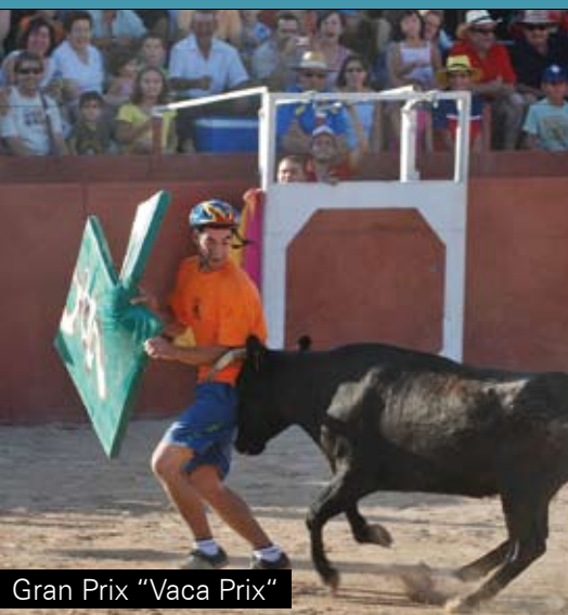
Gran Prix "Vaca Prix"