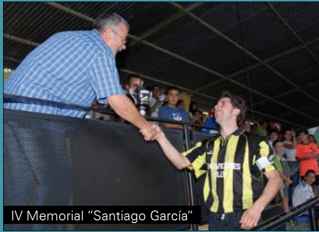
IV Memorial "Santiago García"