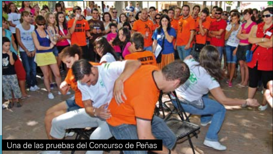
Una de las pruebas del Concurso de Peñas