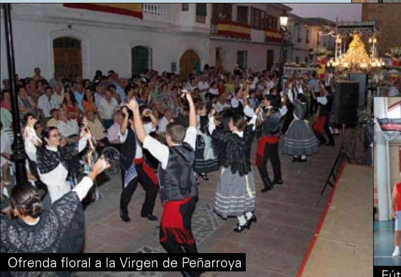
Ofrenda floral a la Virgen de Peñarroya