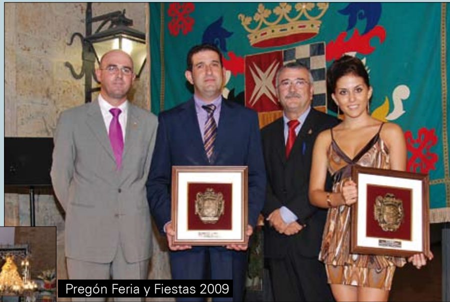
Pregón Feria y Fiestas 2009