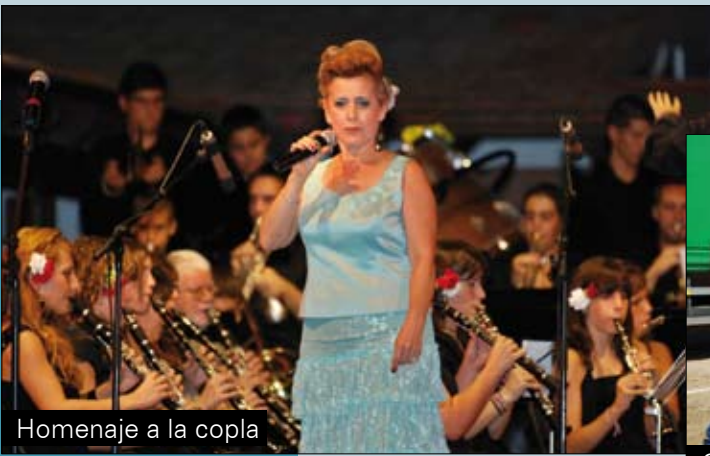
Homenaje a la copla