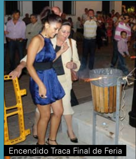
Encendido Traca Final de Feria