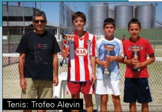
Tenis: Trofeo Alevin