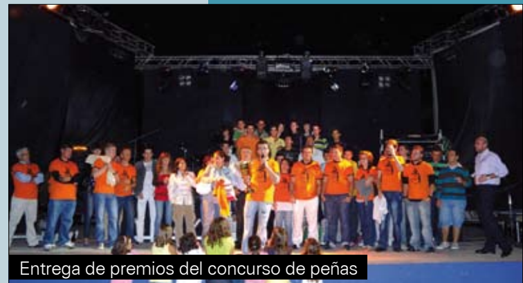
Entrega de premios del concurso de peñas