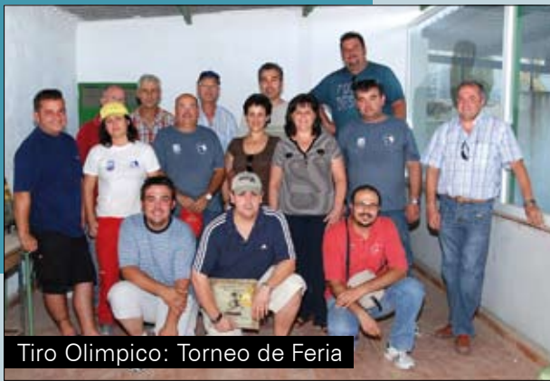
Tiro Olímpico: Torneo de Feria