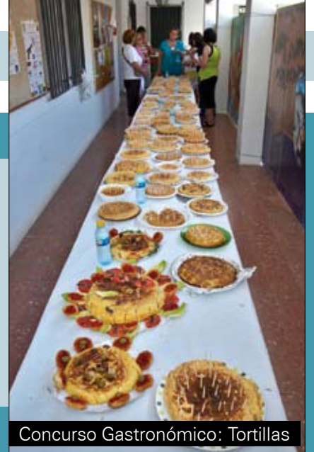
Concurso Gastronómico: Tortillas