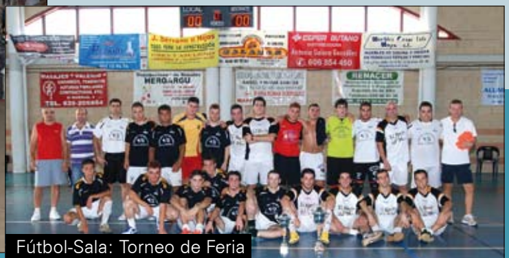
Fútbol-Sala: Torneo de Feria