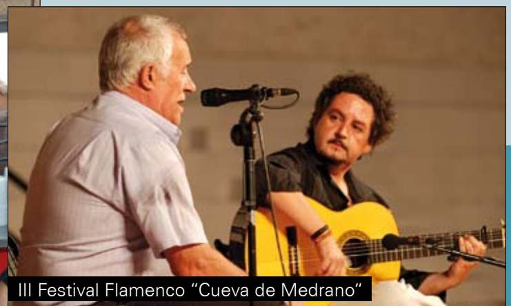
III Festival Flamenco "Cueva de Medrano"