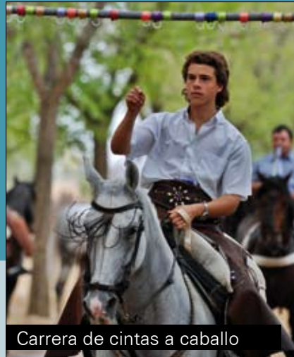
Carrera de cintas a caballo