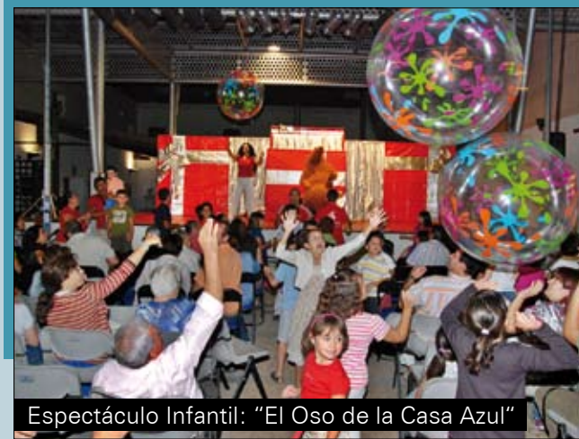
Espectáculo Infantil: "El Oso de la Casa Azul"